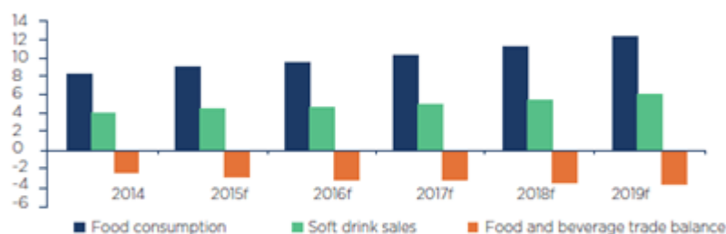
UAE food & beverage sector, billions USD

Coface prevé que los sectores de alimentación y bebidas en EAU se beneficiarán de un mercado interno con altos ingresos, un consumo privado sólido, una gran población de expatriados con crecientes demandas, un fuerte crecimiento económico y el hecho del que el país es un refugio seguro. EAU ha estado invirtiendo en la industria de procesamiento de alimentos un total de 1.400 millones de dólares desde 1994, sobre todo en la industria láctea. El sector de alimentos halal continúa su expansión, y se prevé que crezca hasta los 1,6 billones de dólares en 2018, impulsado por una fuerte demanda de los consumidores que buscan una alimentación variada y natural.